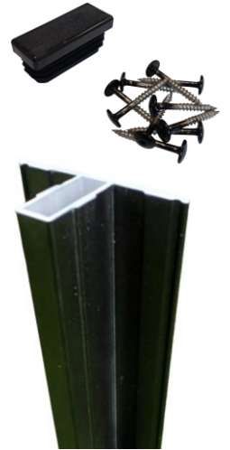
Vue Face avant

Poteau T en aluminium laqué noir (RAL 9005). Idéal pour panneaux bois d'épaisseur 30 à 46mm. Sa forme en T lui confère une grande résistance mécanique et un design discret et élégant. D'une longueur de 270cm, il est fourni avec son capuchon et 10 vis inox 4,8x38mm à tête noire. Poteaux à sceller dans le béton (pas de systèmes sur platines).