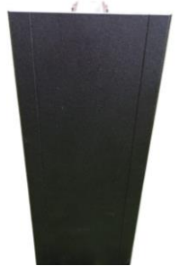
Vue Face arrière