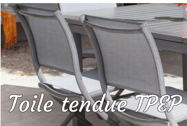
Toile tendue TPEP

Craint le gel et la neige, remiser dans une pièce tempérée en hiver.